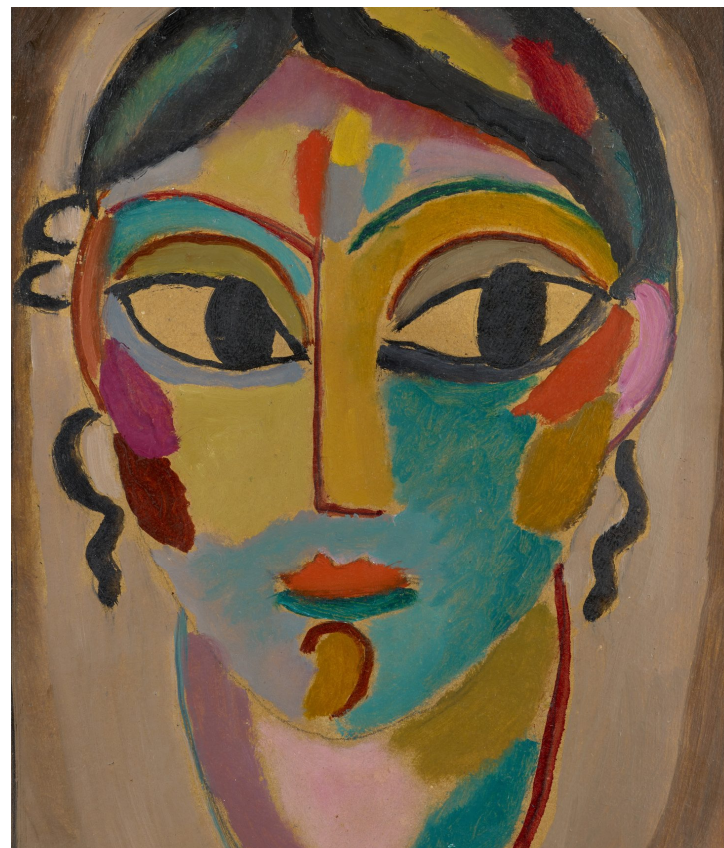
Jawlensky, Mystischer Kopf: Mädchenskopf, 1918

Tekst om udstillingen i uddrag fra Louisianas hjemmeside