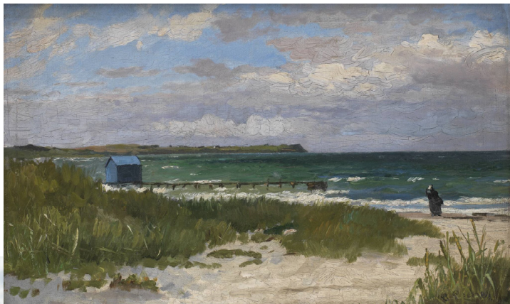
Carl Locher Kystlandskab ved Hornbæk