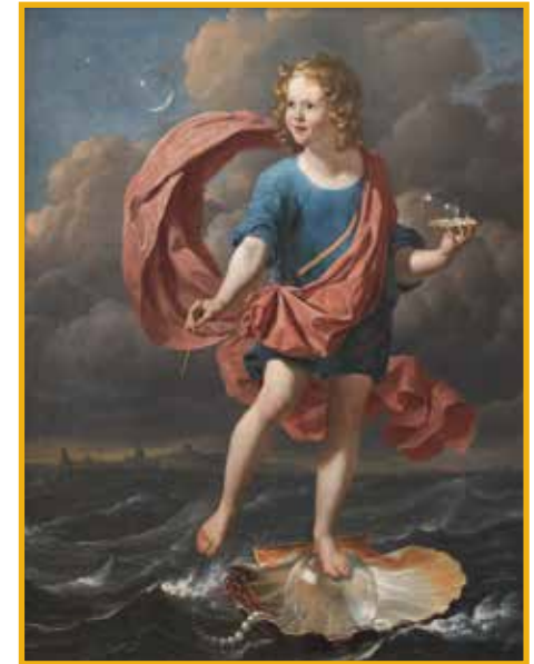
Karel Du Jardin, Boy blowing Soap Bubbles, allegori på forfængeligheden, 1663, SMK