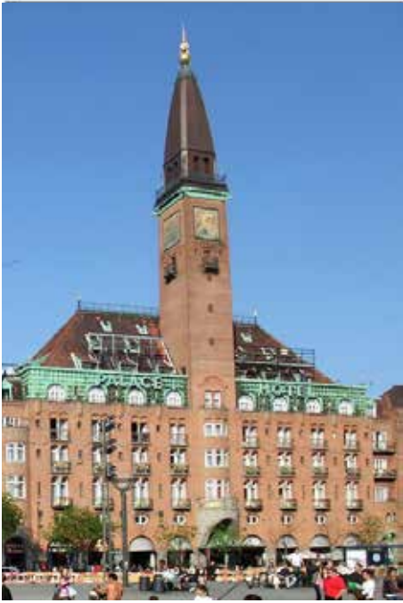
Palace Hotel, Rådhuspladsen