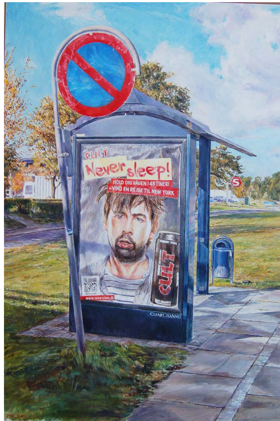
Never sleep`. Busstoppested ved Greve S-togstation. 105 x 70 cm.

Jeg udstiller solo i Gladsaxe Kunstforening, Thorasminde, Lauretsvej, Bagsværd 16.-24. november. Fernisering: lørdag den 16. november kl. 15-16.30. Åbent søndag 13-16, onsdag og torsdag 16-19, samt lørdag 13-16.