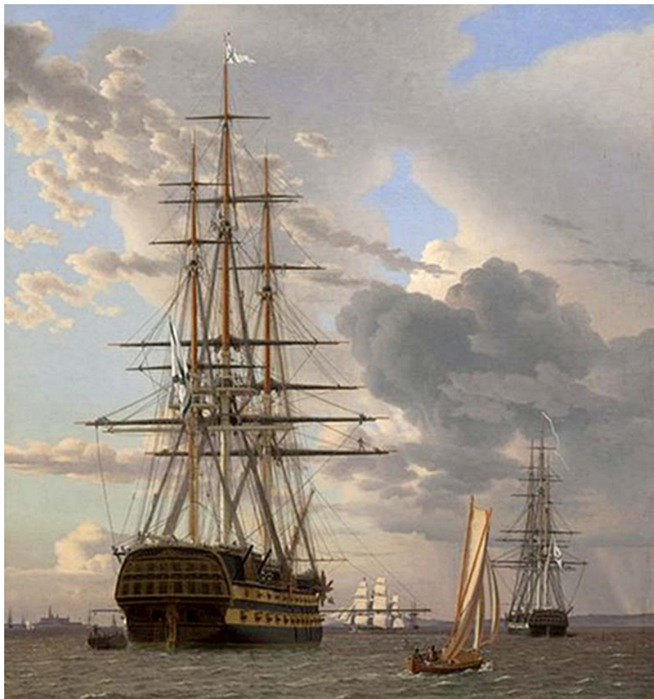
C.W. Eckersberg: Det russiske lineskib "Asow" og en fregat ved Helsingør red. Læs side 2 og 3.