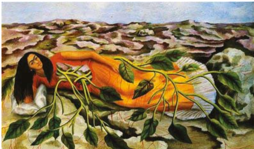
Frida Kahlo: Roots 1911

Udstillingen viser også, hvordan hun iscenesatte sig selv, ikke kun på malerierne, men også i virkeligheden, bl.a. gennem sin påklædning og fremtræden, hvilket dokumenteres i en række fine portrætter taget af kendte fotografer. Det er ligeledes lykkedes at fremskaffe colombianske skulpturer, kjoler, og smykker, som kunne have tilhørt hende.