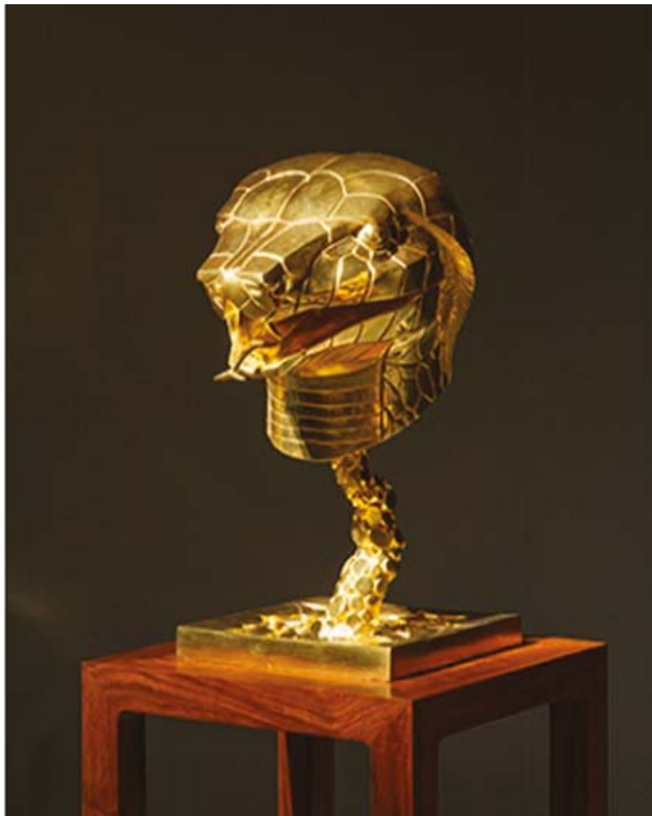
Ai Weiwei: Circle of Animals/Zodiac Heads. 2013. (Slangen)