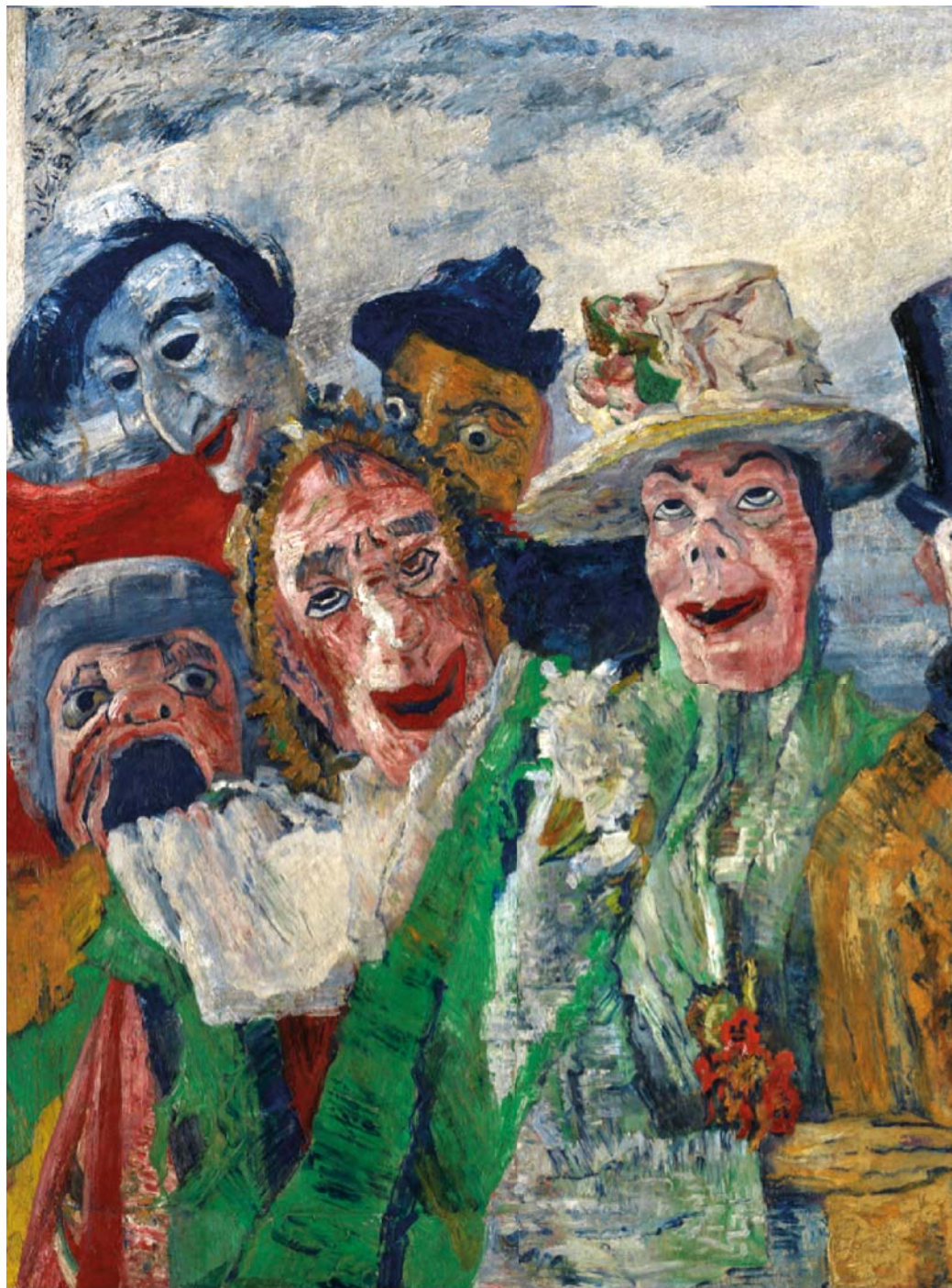
James Ensor: Intrigue, 1911. Olie på lærred