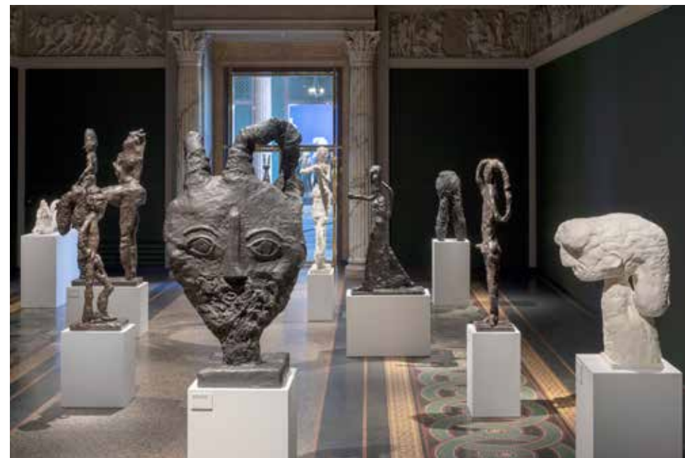
Tal R Bow and Arrow 2019

Tal R er mest kendt for sine malerier og collager, men arbejder også med skulptur, og på Tal Rs nye skulpturudstilling danser, står og går dyr og mennesker i både gips og bronze igennem de gamle sale på Glyptoteket.