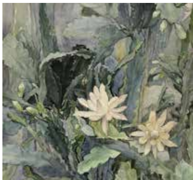
Anna Syberg Blomstrende bladkaktus, 1903 Faaborg Museum