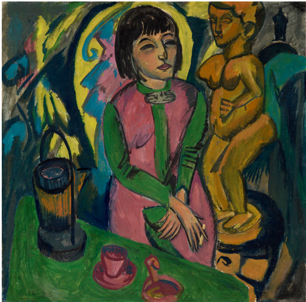
Statens museum for Kunst, Ernst Ludwig Kirchner, "Siddende kvinde med træskulptur", 1912 Virginia Museum of Fine Arts, Richmond.