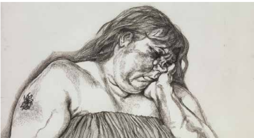
To eksempler på grafiske arbejder af Lucian Freud.